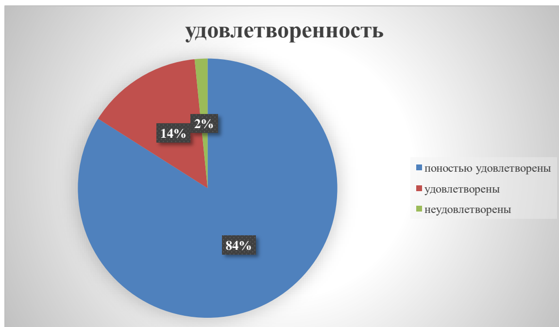
Диаграмма . Удовлетворенность дополнительным образованием